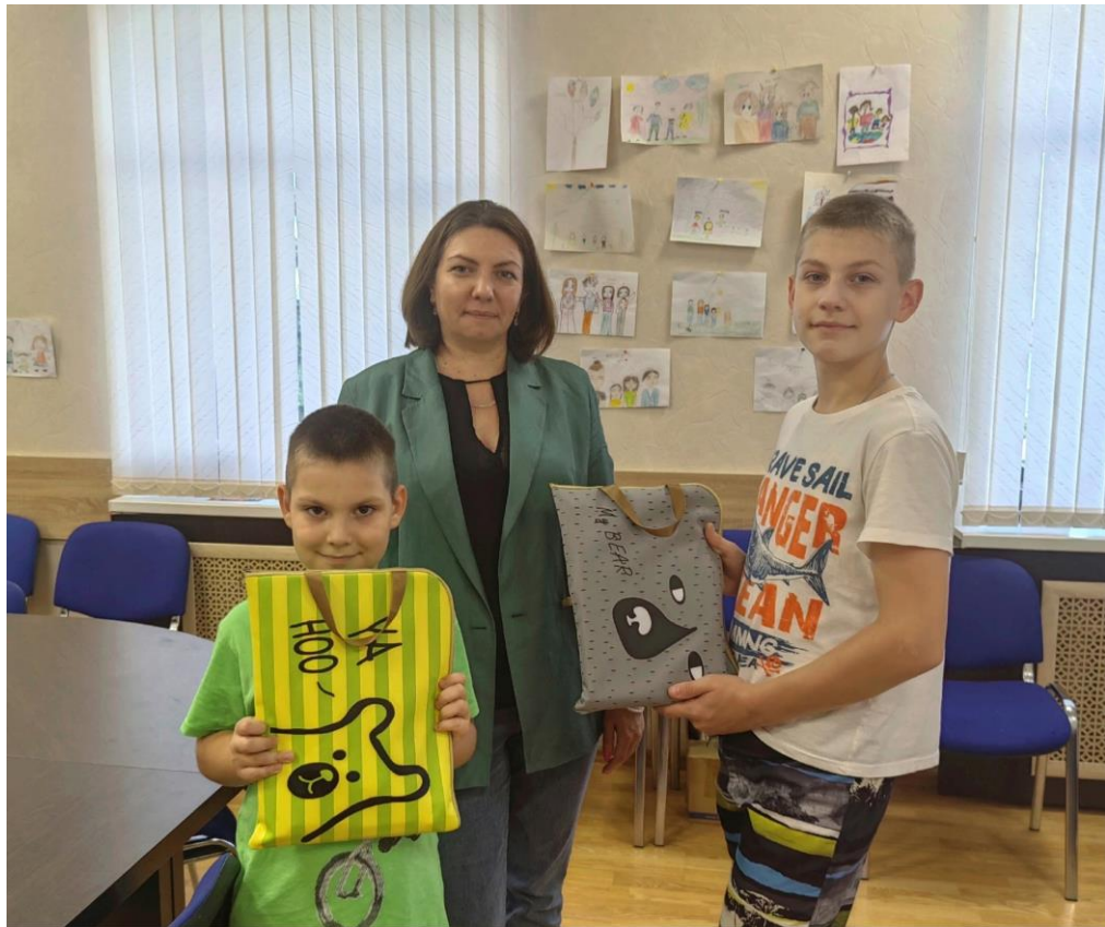
Участие в акции «Собери ребенка в школу»