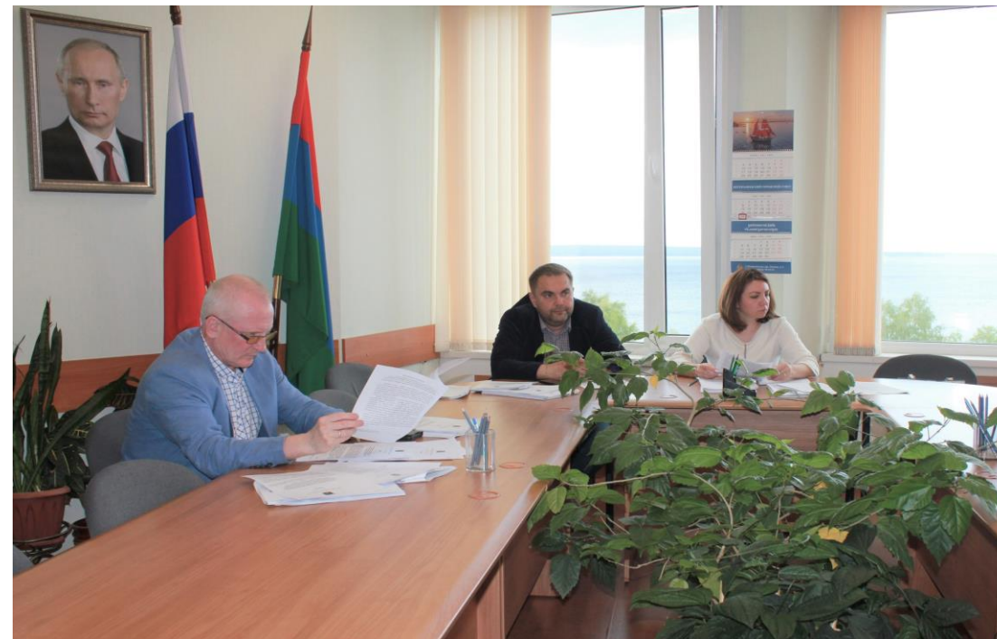
Работа постоянной профильной комиссии по экономике и финансам